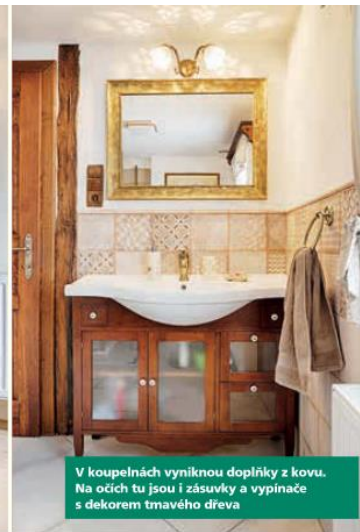
V koupelnách vyniknou doplňky z kovu. Na očích tu jsou i zásvuky a vypínače s dekorem tmavého dřeva