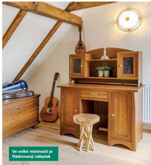
Ve velké místnosti je fíádrovaný nábytek

Ačkoliv se v celé chalupě mísí různé druhy nábytku, staré i nové, spojují je tmavá barva dřeva, jednotný ráz koupelen, kde jsou použity