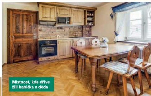
Místnost, kde dřívě žili babička a děda