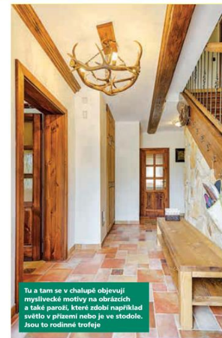
Tu a tam se v chalupě objevují myslivecké motivy na obrázcích a také paroží, které zdobí například světlo v přízemí nebo je ve stodole. Jsou to rodinné trofeje