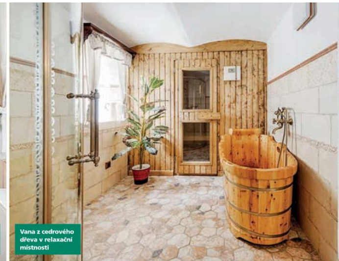
Vana z cedrového dřeva v relaxační místnosti