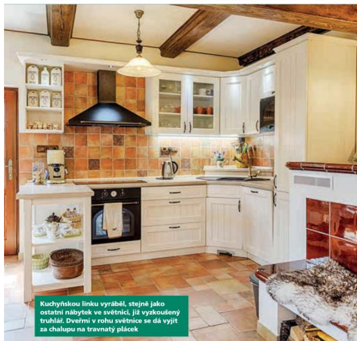
Kuchyňskou linku vyráběl, stejně jako ostatní nábytek ve světnici, již vyzkoušený truhlář. Dveřmi v rohu světnice se dá vyjít za chalupu na travnatý plácek

Pán domu dává přednost nábytku z tmavého dřeva, jeho paní zvolila alespoň ve světnici mix barev