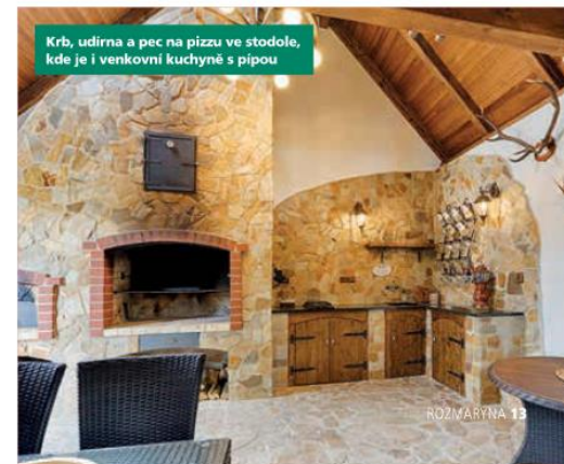
Krb, udrna a pec na pizzu ve stodole, kde je i venkovní kuchyně s pipou

www.lenka-design.com , www.podjestedka.cz